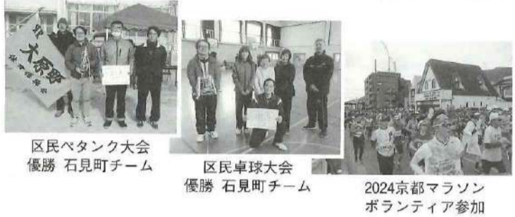
区民ベタンク大会 優勝 石見町チーム