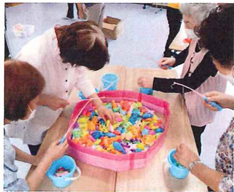
みんなでごろごろ魚つり