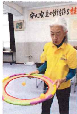
フラフープぐるぐるポン