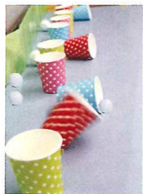
紙コップにホールインワン