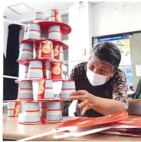
うちわでぐらぐらジェンカ

毎月第2火曜日開催の健康すこやかサロンでは、「すこやか体操」に始まり、ストレッチ、筋トレを行います。テレビや雑誌で紹介された健康に役立つ情報や体操も取り入れています。また、季節のつたを歌いながら口腔体操や脳トレを行い、音楽に合わせて楽しくダンスも踊ります。 一番盛り上がるゲームはインスタグラムでヒントを得て手作りしています。ゲームは筋トレ、脳トレにも役立ちます。是非参加をお待ちしております。